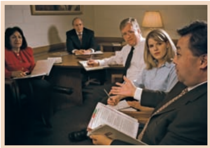
Vadovaujama vyskupo, apylinkės taryba padeda išspręsti gerovės reikalus.

Esant reikalui, konfidencialūs klausimai gali būti aptariami kunigijos vykdomajame komitete, pakvietus dalyvauti Paramos bendrijos prezidentūrą.