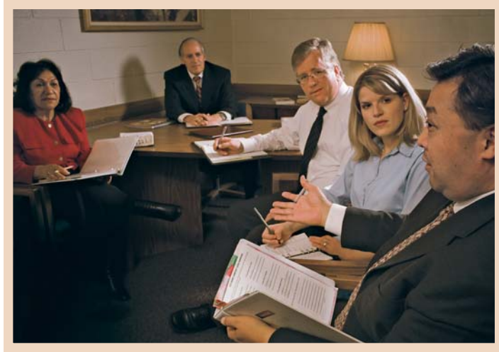
ภายใต้การกำกับดูแลของอธิการ สภาวอร์ดจะช่วยจำแนกความจำเป็นด้านสวัสดิการ